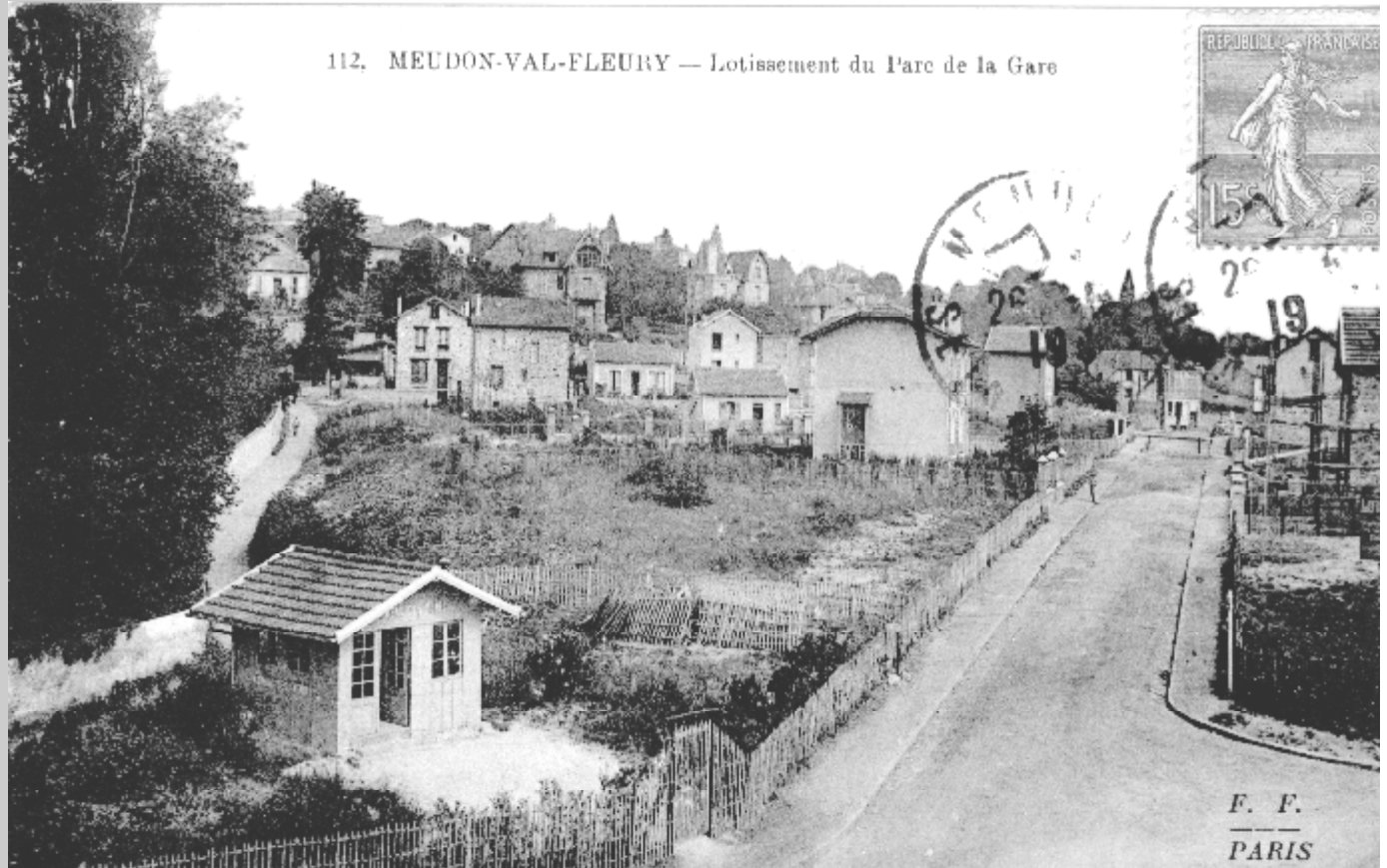
112. MEUDON-VAL-FLEURY — Lotissement du Parc de la Gare